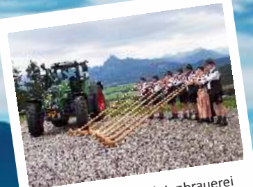
Übergabe Fendt-Aktienbrauerei Schlossbergalm 2007