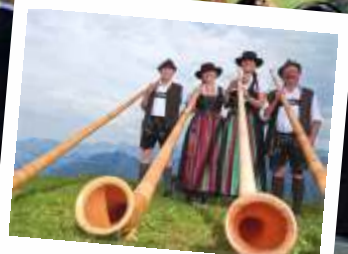
Berglarkirbe Fellhorn 2014