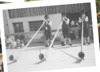
Dorffest 1977 in Zell - Eisenberg