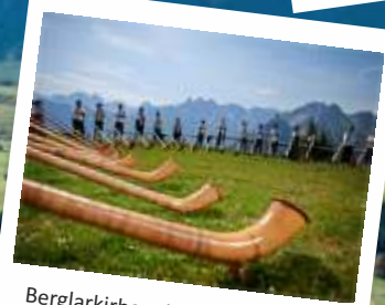
Berglarkirbe mit Euregio-Gruppe Fellhorn 2014