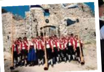
Ruinenfest 1988 - als die Alphörner noch zur Musikkapelle gehörten