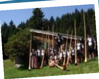
Mariä Himmelfahrt Gundhütte 2009